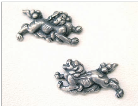
刀の目貫 (刀もち手のところの小さな金具) の打ち出し技法。

その時代の日本の金工師たちの仕事は世界レベルから見ても超絶技巧的であり、さらに彼らはアーティストでした。