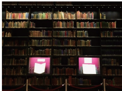
東洋文庫ミュージアム

2015年11月30日、駒込にある東洋文庫ミュージアム・講演室でジュエリー・アーティスト・ジャパン (JAJ) の活動報告発表をいたしました。JAJ はジュエリーアーティスト・クラフトマン等の若手の活動と支援を主な目的とした、ジュエリークリエイターのためのコミュニティです。当日は、大使館、ジュエリーデザイナー協会、クラフトマンの団体、その他 NPO 法人の方々からお話を頂戴いたしました。加えて JAJ の活動報告および、今後の活動の展望をお話しさせていただきました。