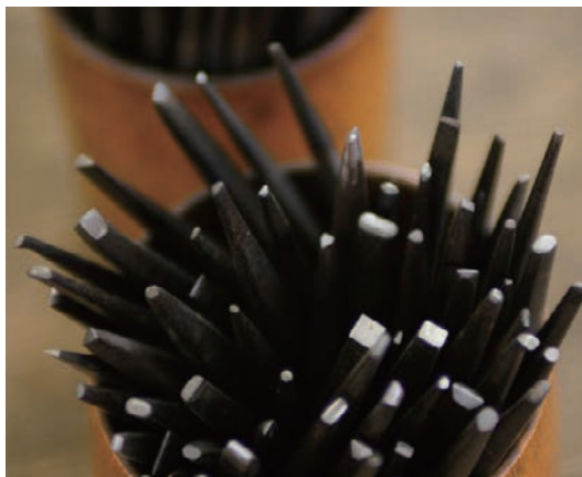
江戸時代からの鑿 (たがね) を引き継いで使っている職人も。